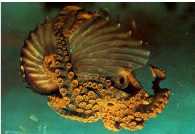
Figura 2 - l'argonauta