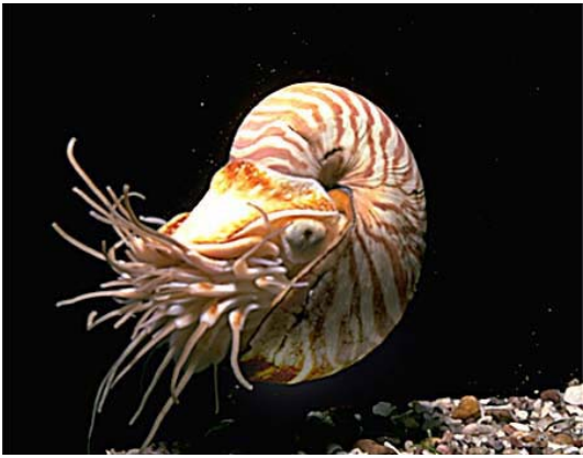
Figura 3- il nautilus