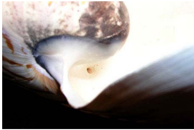
Figura 4-il canale che consente al nautilus di allagare e svuotare le cellette