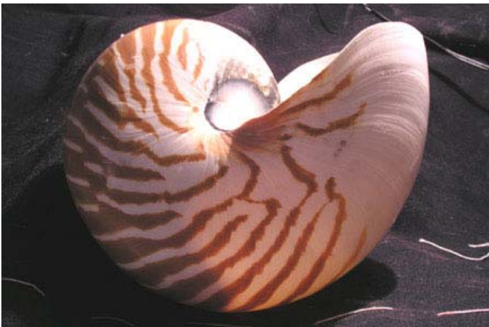
Figura 5-la delicata conchiglia

E' assolutamente vietata la riproduzione, anche parziale, del testo e delle foto presenti in questo articolo, senza il consenso dell'autore.