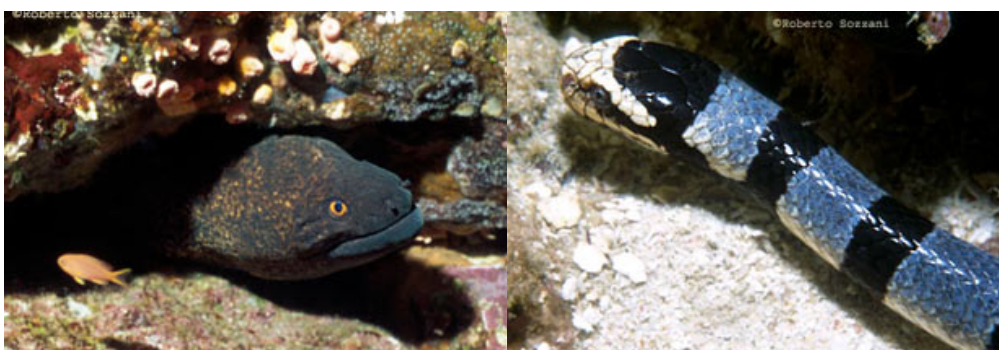
La murena Gymnothorax-flavimarginatus ed il serpente di mare Laticauda-colubrina.

Le carni (ma soprattutto gli organi interni come il fegato e le gonadi) dei tetraodontidi, famiglia a cui appartiene appunto il pesce istrice, sono particolarmente velenose per la presenza di un veleno neurotossico, la tetrodotossina, che provoca paralisi respiratoria e spesso la morte anche nell'uomo. Questa tossina è molto simile alla saxitossina (saxitossina) accumulata da alcuni molluschi filtratori che si nutrono di dinoflagellati tossici presenti nel plancton. I pesci che si nutrono a loro volta di questi molluschi la accumulano nel loro fegato e questo si ripete allorché i pesci intossicati diventano a loro volta prede di altri. Sia la tetrodotossina che la saxitossina sono alcaloidi resistenti al calore per cui il loro effetto tossico resiste anche alla cottura prolungata. Tra i pesci non si riscontrano invece esempi di avvelenamento da morso, come invece accade frequentemente nei serpenti. La credenza che la murena (in tutte le sue specie, sia tropicali che mediterranee) abbia un morso velenoso come quello dei rettili, è infondata.