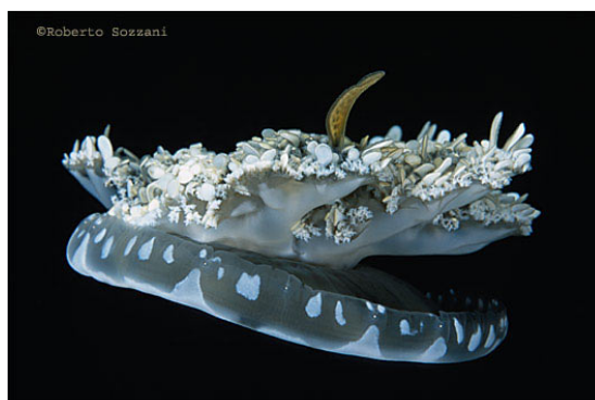
La medusa Cassiopeia.

In natura molte delle classi animali e vegetali utilizzano vari tipi di tossine per difendersi dai predatori o per cacciare le loro prede. La virulenza di questi veleni è in proporzione all'obbiettivo che deve raggiungere: se lo sfiorare una medusa o un'attinia ci crea solo delle irritazioni cutanee, non altrettanto avviene ai piccoli invertebrati o pesciolini di cui tali animali si nutrono. La paralisi e la morte delle piccole prede ne sono un'evidente dimostrazione. Possiamo dividere i veleni in due grandi categorie: i neurotossici e gli emolitici. I primi agiscono sul sistema nervoso provocando l'interruzione della trasmissione dell'impulso nervoso, con temporaneo intorpidimento della zona colpita e acuto dolore.