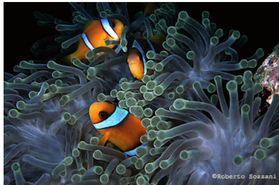
I pesci pagliaccio Amphiprion-bicinctus nel loro anemone.

In questo scenario di temibilissimi tentacoli, si sviluppano però delle strane associazioni tra predatori e possibili prede: le simbiosi. Una delle più conosciute è sicuramente quella che avviene nei mari tropicali fra l'anemone (Stoichactis, Radianthus, Discosoma) ed il pesce pagliaccio (Anphiprion). Ma pochi sanno che anche nel Mare nostrum, a pochi metri dalla riva dove prendiamo il sole, ne esiste una molto simile tra l'anemonia sulcata e un ghiozzetto (Gobius bucchicchii). In entrambi i casi i pesci riescono a sopravvivere e a trovare riparo tra i tentacoli dell'anemone senza esserne feriti, ma come fanno? Secondo la tesi più accreditata i pesci si ricoprirebbero di un muco protettivo secreto dall'anemone, diventando, per così dire, parte dell'anemone stesso.