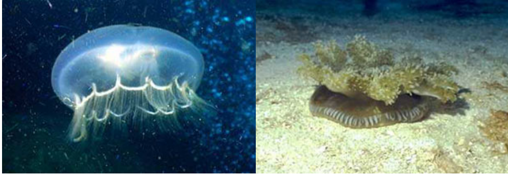
Le meduse Aurelia aurita e Cassiopea frondosa.

In questo scenario di temibilissimi tentacoli, si sviluppano però delle strane associazioni tra predatori e possibili prede: le simbiosi. Una delle più conosciute è sicuramente quella che avviene nei mari tropicali fra l'anemone (Stoichactis, Radianthus, Discosoma) ed il pesce pagliaccio (Anphiprion). Ma pochi sanno che anche nel Mare nostrum, a pochi metri dalla riva dove prendiamo il sole, ne esiste una molto simile tra l'anemonia sulcata e un ghiozzetto (Gobius bucchicchii). In entrambi i casi i pesci riescono a sopravvivere e a trovare riparo tra i tentacoli dell'anemone senza esserne feriti, ma come fanno? Secondo la tesi più accreditata i pesci si ricoprirebbero di un muco protettivo secreto dall'anemone, diventando, per così dire, parte dell'anemone stesso.