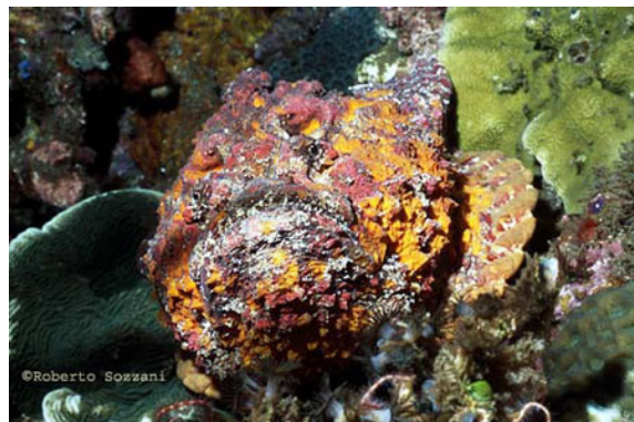
Synanceia verrucosa.

Per questo motivo l'evoluzione ha premiato in loro l'agilità e l'acuità dei sensi piuttosto che dotarli di armi velenose per la difesa. Un predatore come il pesce pietra ( Synanceia verrucosa ) affida la sua sopravvivenza alla capacità di catturare le sue prede mimetizzandosi sul fondale roccioso e alla repentinità dell'attacco, lasciando così poche possibilità all'ignaro pesciolino.