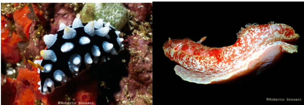
I nudibranchi Phyllidia ocellata Hexabranhus sanguineus.

Questo spiegherebbe perché l'evoluzione li ha dotati di appendici velenose, ma i loro colori vistosi quale scopo hanno? In etologia questi vengono definiti colori aposematici. L'essere così piccoli e fragili, seppur velenosi, non li salverebbe comunque dalla morte: un predatore li fiuterebbe, li addenterebbe e poi li sputerebbe, ma la loro delicata struttura non sopporterebbe un simile sconquasso. Ecco quindi che le vistose appendici dai colori vivaci servono da segnali di allerta per i predatori: "sono qui, ma sono velenoso" è il messaggio che inviano loro. Meduse, attinie e anemoni lasciano fluttuare nell'acqua i tentacoli urticanti, pronti ad iniettare i loro veleni al minimo contatto con una possibile preda. Anche in questo caso siamo in presenza di sostanze neurotossiche che provocano la paralisi degli animali catturati, che così immobilizzati saranno portati alla bocca più facilmente.