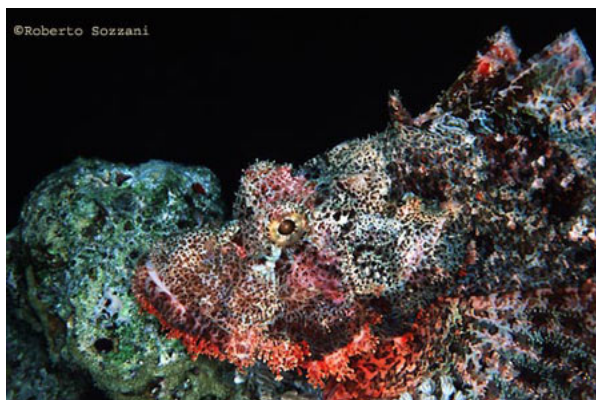
Scorpaenopsis oxycephalus.

D'altra parte nulla potrebbe fare nel caso venisse individuato da un predatore più grosso: la sua forma goffa e per nulla idrodinamica non gli permetterebbe certo di fuggire veloce; la sua spiccata territorialità, che lo spinge ad allontanare i suoi simili, consente in tal modo al cacciatore di concentrarsi unicamente su di lui, lasciandogli ben poche vie di scampo. La natura lo ha però dotato di aculei veleniferi collegati a vere e proprie ghiandole del veleno, in grado di scoraggiare anche il più accanito predatore.