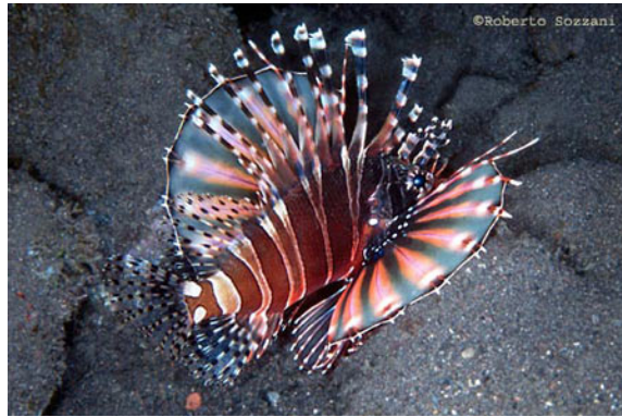
Dendrochirus zebra.

Per questo motivo l'evoluzione ha premiato in loro l'agilità e l'acuità dei sensi piuttosto che dotarli di armi velenose per la difesa. Un predatore come il pesce pietra ( Synanceia verrucosa ) affida la sua sopravvivenza alla capacità di catturare le sue prede mimetizzandosi sul fondale roccioso e alla repentinità dell'attacco, lasciando così poche possibilità all'ignaro pesciolino.