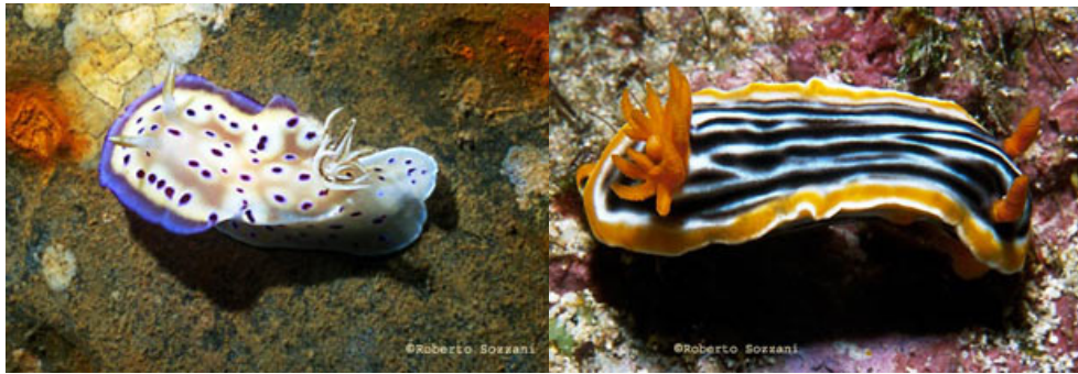
I nudibranchi Chromodoris kuniei e Chromodoris magnifica.

In mare i veleni vengono utilizzati da una infinità di organismi e anche tra gli invertebrati si trovano situazioni interessanti da analizzare. I gasteropodi nudibranchi sono spesso ornati di appendici molto vistose e colorate, ricche di cellule urticanti. Questi animali, privi di conchiglia protettiva e dai movimenti lenti ed eleganti, non possono sfuggire ai loro predatori. Potrebbero mimetizzarsi con l'ambiente (ed alcune specie lo fanno), ma in un mondo subacqueo di cacciatori dal fine odorato avrebbero poche possibilità di scampo.