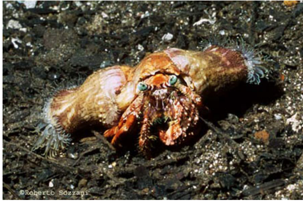
Il paguro Dardanus-pedunculatus.