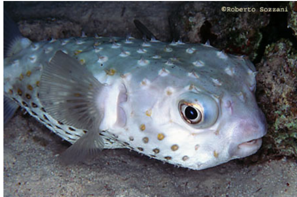
Il pesce istrice Cyclichthys spilostylus.

L'acuto dolore e il momentaneo stordimento provocato dalla sua puntura sull'aggressore, gli permettono di spostarsi e di mimetizzarsi altrove. Altri pesci, come ad esempio il pesce istrice ( Diodon hystrix ), si difendono dai predatori gonfiandosi a dismisura, ingurgitando acqua o aria sino a permettere l'innalzamento degli aculei su tutta la superficie del corpo, rendendo anche in questo caso impossibile l'attacco dei predatori.